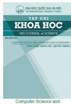
Computer Science and Communication Engineering