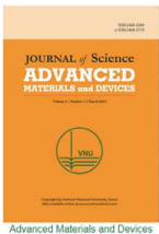
Advanced Materials and Devices