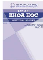
Mathematics and Physics