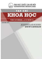
Economics and Business