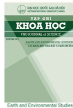
Earth and Environmental Studies